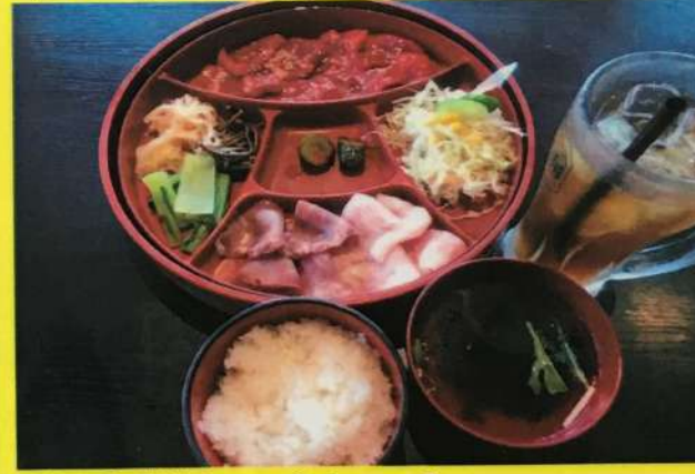
十兵衛ランチセット