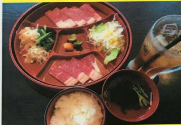
牛サーロインランチセット